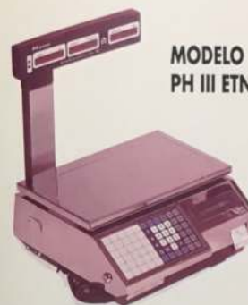
MODELO PH III ETN