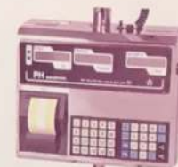
MODELO PH 201 IPFV2N